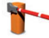
Système de regonflage automatique