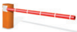
Lisse Protecta en fibre de carbone